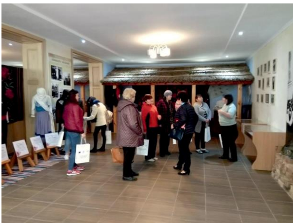
Работно посещение N3