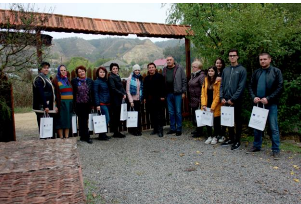
Работно посещение N2